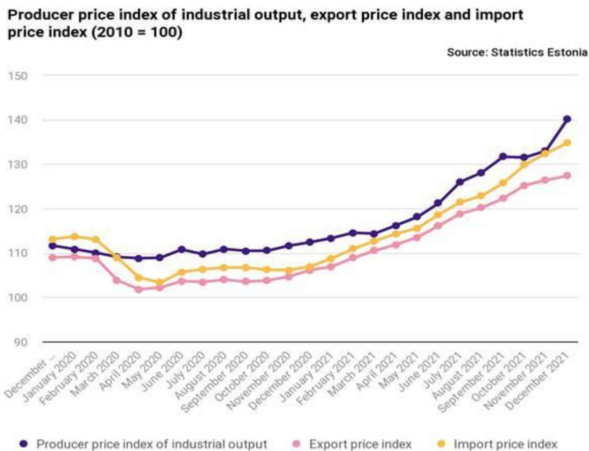
图 1 工业生产价格指数、出口价格指数及进口价格指数 (2010=100)