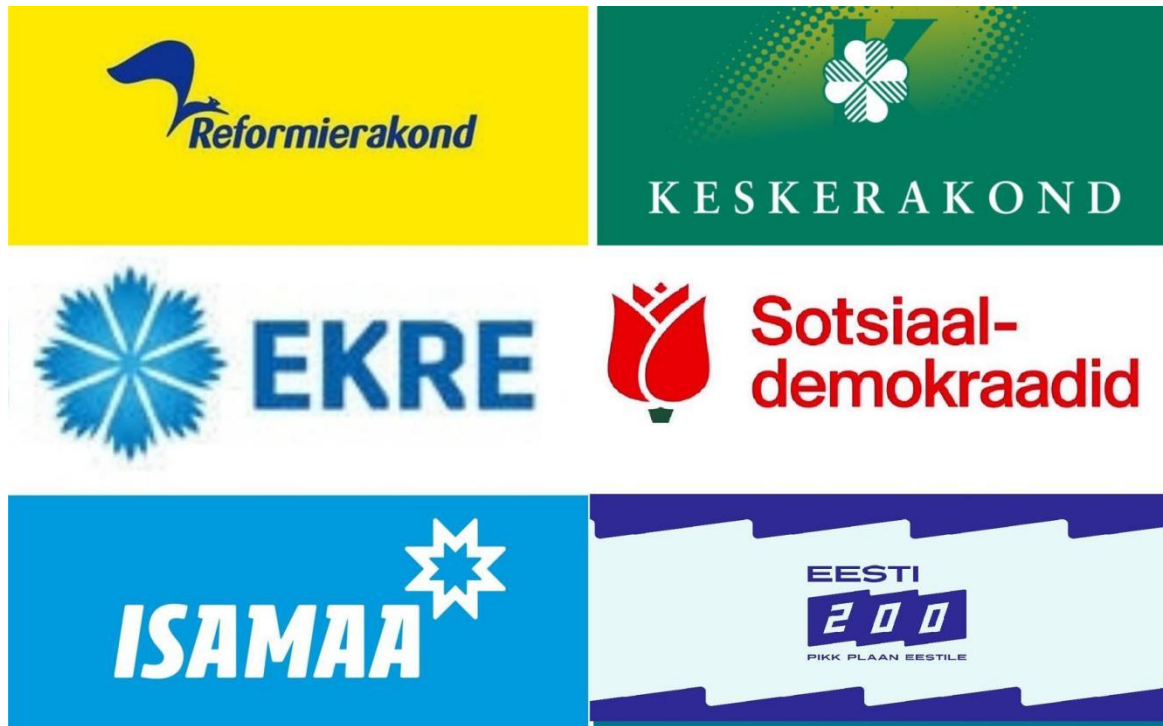
图1 爱沙尼亚6大政党的标志